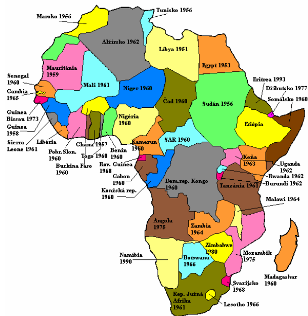
Obrázok 2: Dekoloniácia Afriky